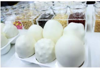
なんのたまご？ / 大泉義一 見た目は「卵」。 触ってみるとあれ？何の卵かな？