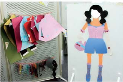
きせかえ人形 / 魏棋 お気に入りの服に着替えて、 いつもの自分から変身してみよう。