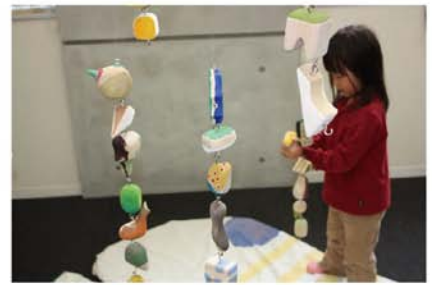
つなげるモビール / 間瑤子 バランスをとりながら、 自分の好きなモビールどうしをつなげてみよう。