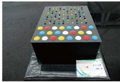
スイッチ / 原田萌 思う存分、スイッチを入れるのって楽しい！ …何が起こるかな？