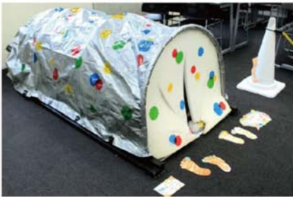
きつきほらあな / 中村めぐみ+高橋侑子+平谷佳世 全身で感じながら「ほらあな」でなごもう。