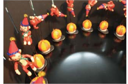
なにがみえるかな？ / 広瀬美純 切り込みから中をのぞいてまわしてみると…。