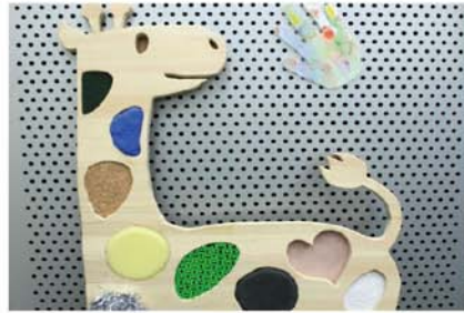
さわる さわる / 山下真菜 いろいろな触りごち。お気に入りは何れ？