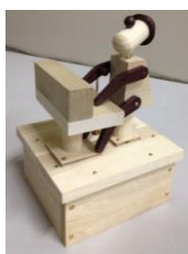
オルゴールの 製作 (右)