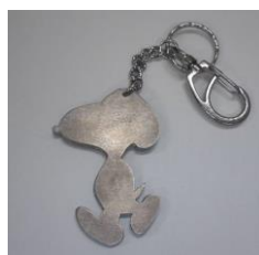
キーホルダの 製作 (左)

技術科は、木材加工、金属加工、栽培学など、主に作業を中心とした授業になります。「がつり技術」というイメージを持たれる方もいますが、教員との距離が近いのですごく密に、少人数ということもありますが濃く学べると思います。